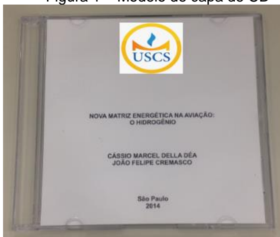
Figura 1 – Modelo de capa de CD

Importante: Os trabalhos de TCC entregues fora do prazo estabelecido terão um decréscimo de 1,0 ponto na nota final para cada período de três dias úteis de atraso.